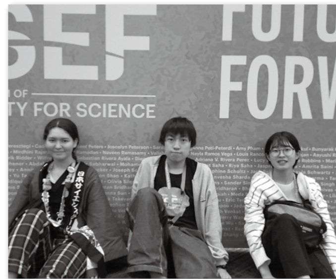
ISEF2023に出場したファイナリストたち