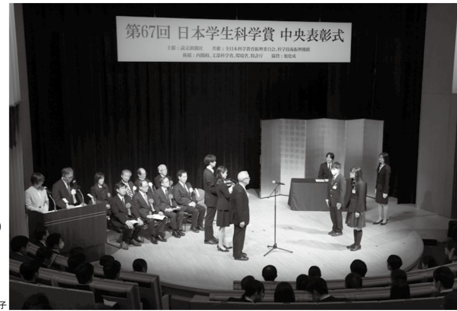
第67回大会中央表彰式の様子

高校生が中央最終審査で 上位入賞すると、 学校推薦型選抜や 総合型選抜の受験資格が 得られるほか、 ISEF2025へ出場できる チャンスがあります。