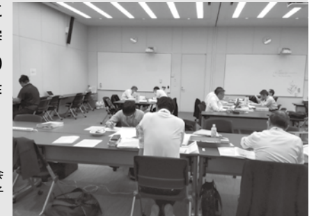
第67回大会 中央予備審査会の様子

審査委員が分野ごとに審査を行い、中央最終審査に進む中学・高校各20点と、入選2等、3等の作品を決定します。