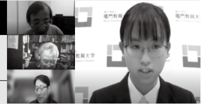
第67回大会中央最終審査会(オンライン)の様子 ※一部画像を加工しています

中央予備審査を通過した研究作品40点について、審査委員が直接研究者に質問するオンライン審査を行います。