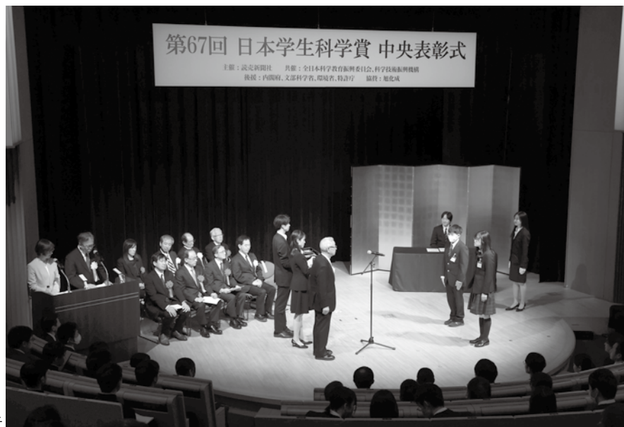
第67回大会中央表彰式の様子

高校生が中央最終審査で 上位入賞すると、 学校推薦型選抜や 総合型選抜の受験資格が 得られるほか、 ISEF2025へ出場できる チャンスがあります。