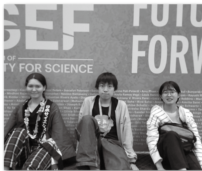
ISEF2023に出場したファイナリストたち